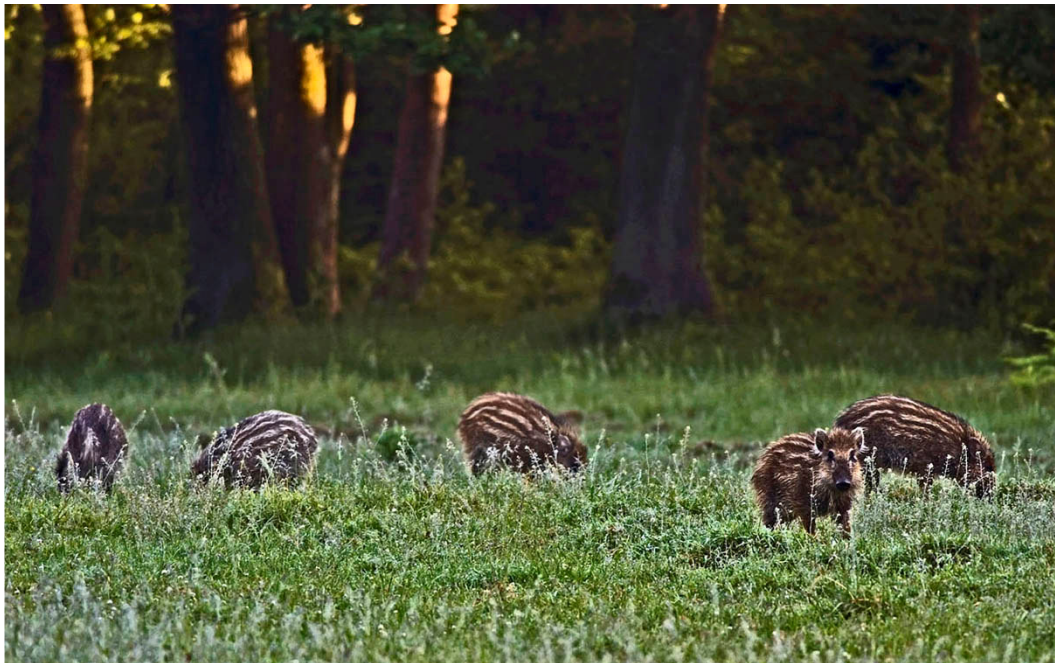
zwijntjes op de Lange Akker